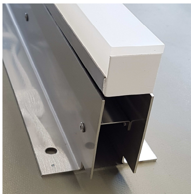
Lichtlinie teilweise eingesetzt